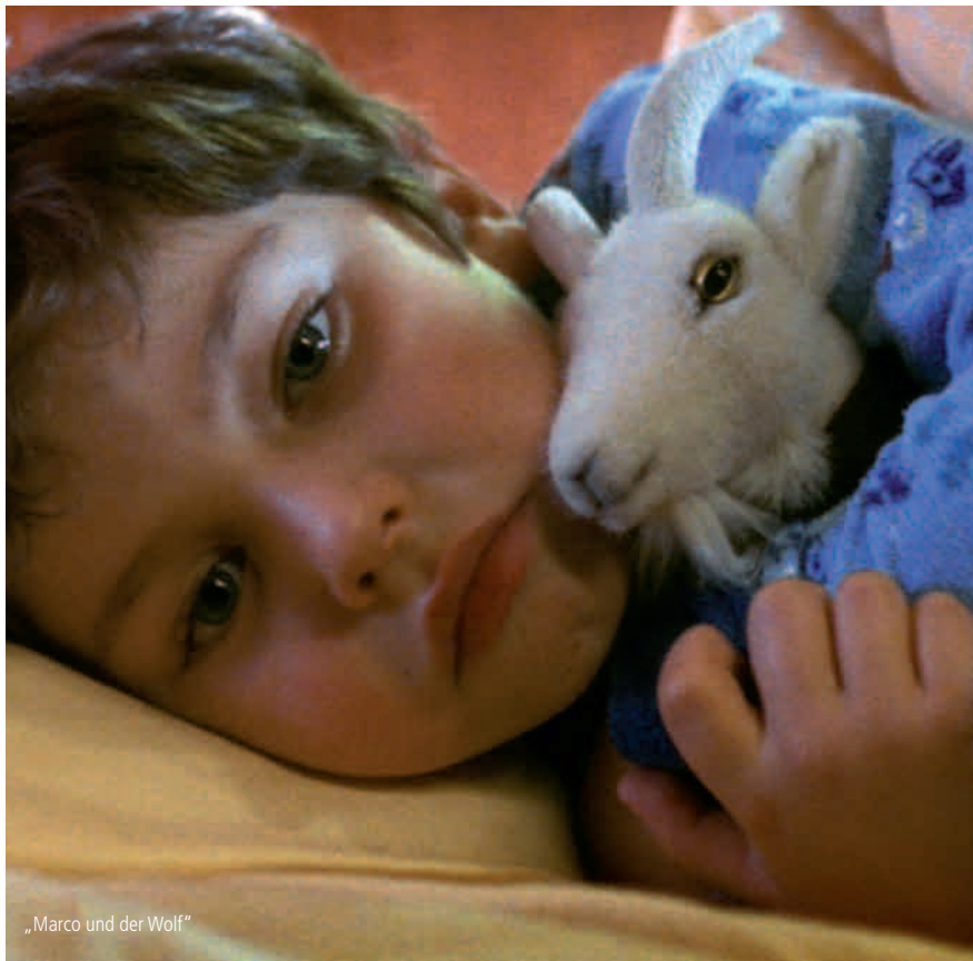
„Marco und der Wolf“