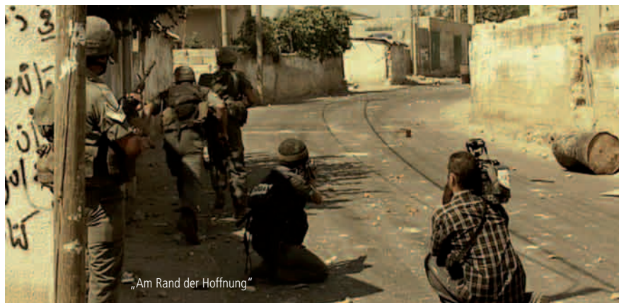
„Am Rand der Hoffnung“