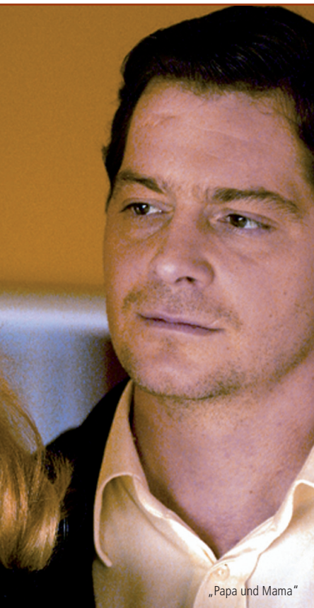
„Papa und Mama“

Klangexperimente: So bietet ausgerechnet die Musik zu einer Krimireihe wie „Bella Block“ den meisten Platz für ruhige, suggestive Klangräume, für E-Musik und Klavier. So lernt man die andere Seite von Ralf Wengenmayr kennen: Man spürt und hört einen Komponisten, dessen Ambitionen weit weg vom bloßen „Bedienen handwerklicher Dienstleistungen“ gehen. Gerne würde er, der bereits erfolgreich ein Klavierkonzert geschrieben hat, weiter in Richtung Konzertbetrieb arbeiten. Suiten sollen aus seinen Erfolgsmusiken entstehen, unbekanntere Kompositionen für Film und Fernsehen „aufbereitet“ werden, und vielleicht soll auch einmal eine Sinfonie in Angriff genommen werden – wer weiß?! So offen und engagiert sich Wengenmayr gegenüber der ganzen Bandbreite von Musik für Unterhaltungsfilme zeigt, so interessiert ist er auch am atonalen Klang. Die fünf Kompositionen, für deren Veröffentlichung auf der vorliegenden CD er sich entschieden hat, sind lyrisch und ausladend („Sterne über Madeira“), spannend und ernsthaft („Countdown“), subtil und suggestiv („Bella Block“), zerbrechlich und emphatisch („Papa und Mama“), melancholisch und mitreißend („Zwischen Liebe und Leidenschaft“). Allen fehlt der „Atem des Entertainment“ – und das ist gut so. Es ist Musik, bei der man das Herzblut des Komponisten spürt – und das ist noch besser so.